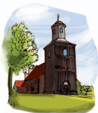
Греко-католическая церковь в Остре Бардо рис. RS

• Остре Бардо – небольшая деревня вблизи границы с Россией. Здесь находится позднеготический костел начала XVI в. 79 , почти всю свою историю (до 1945 г.) служивший евангелистам. Костел построен из булыжника и кирпича, с востока к нему пристроена деревянная башня. После выселения немцев в деревню переселили много украинцев из Бещад. Сейчас храм действует как греко-католическая церковь.