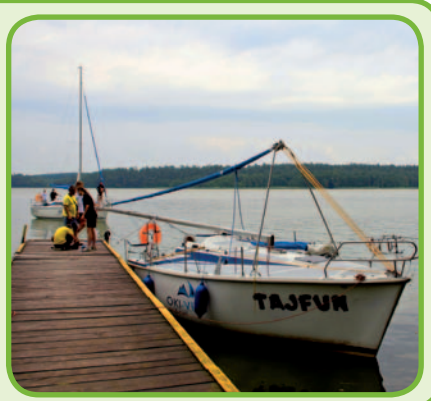
Озеро Нидское, фото GEP Chroszcz

Озеро, окруженное обширным бором Пишской пущи – это без сомнения одно из самых красивых озер Мазурского поозерья. Площадь поверхности озера составляет 1,8 тыс. га. Длина озера 23 км, ширина от 200 м до 2 км, а глубина 23 м. Водоем образовался в пропасти, оставленной после последнего схождения ледника. Типичными для таких озер являются высокие и крутые берега. Привлекательность водоему придают многочисленные бухты и 13 островов, главным образом находящихся в окрестностях Нида. Полоса леса вдоль берега, а также само озеро, находится под охраной. На этих территориях был основан ландшафтный заповедник Озеро Нидское, площадь поверхности которого составляет почти 3 тыс. га. Благодаря этому на водах озера всегда тихо и спокойно – в заповеднике на озере необходимо соблюдать тишину.