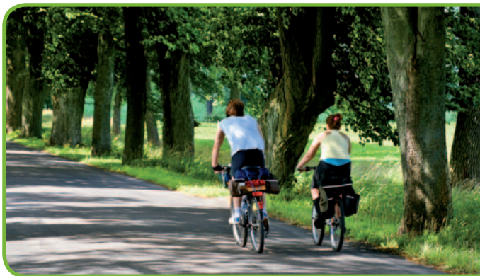
На местных дорогах