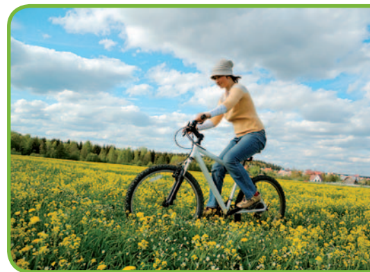
По зеленому маршруту

Маршрут почти везде проходит по асфальтированным дорогам с малой интенсивностью движения. Уровень сложности: легкий.