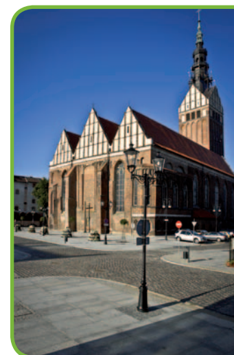
Собор св. Николая в Эльблонге

Равнины на западе от озера Друзно, по которым проходит маршрут – это Жулавы Вислы. Так называется дельта, которую создала Висла, впадая в Балтику. Влажные земли дельты были осушены и освоены религиозными изгнанниками из Голландии. Преследования на родине вынудили течение протестантских анабаптистов, сторонников религиозного реформатора Меннона Симмонса, искать новых толерантных соседей. Таким местом стала Польша XVI в. Принесенные из Голландии знания на тему мелиорации и защиты от наводнений территорий, расположенных на депрессии, позволила меннонитам обжить дельту Вислы. По сей день на этой территории находятся многочисленные оставленные ими памятники – прекрасные дома с аркадами из так называемого фахверка, кладбища и гидротехнические сооружения, на которые можно набрести, путешествуя по Жулавам по Пути меннонитов.