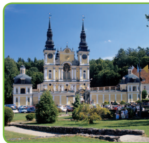
Внутренний двор замка в Кентшине