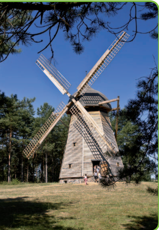
Памятник битве под Грюнвальдом, фото И. Прушиньска Скансен в Ольштынке, фото Д. Заруд

• Маньки – в деревне, расположенной на большой лесной поляне, стоит каменный костел конца XVII в. 103 , заверченный в 1770 г. Скромному корпусу добавляет красоты башня с избицей (тип надставленного