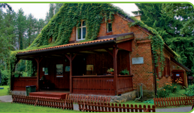
Пристань Руцяне-Нида