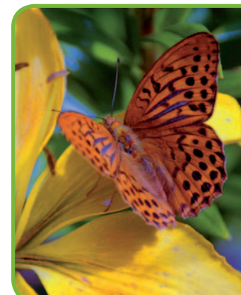
Природа региона

• Заповедник Образик – охватывает свыше 66 га леса и торфяников, а также маленькое озеро Здренчно, расположенное между озером Пясечно и поселком Образик. Территория относится к холмистой моренной возвышенности. Озеро расположено в углублении между холмами, постепенно зарастает, благодаря чему вокруг него образуются натуральные переходные болота. Территория заповедника является местом обитания журавлей.