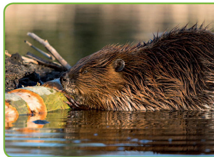
Храм св. Екатерины в Лукте