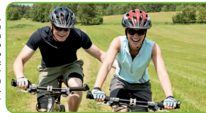
Дорога в поле, фото iStockphoto.com

• Устник – небольшая деревня у озера с таким же названием в свое время была частью обширных помещичьих владений влиятельных прусских родов. В начале XX в. владения были разделены на две части, поэтому здесь по соседству находятся два запущенных имения 81 .