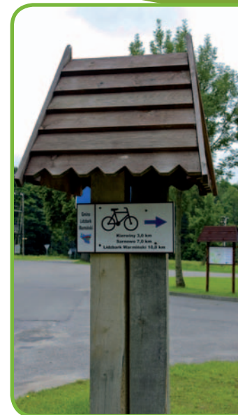
Маршрут в Сточке Кляшторном

• Сточек Кляшторны – над деревней, основанной в середине XIV в., возвышается барочный костел. Он составляет главную часть монастырского комплекса 94, выросшего на месте поставленной среди леса в 1622 г. часовни Богоматери. Варминский епископ Николай Шишковский основал в 1639–41 гг. костел в форме большой ротонды под куполом. Внутри помещена привезенная из Рима, из базилики Санта Мария Маджоре, копия иконы Богоматери, называемая Мать Мира. Спустя несколько лет храм перешел к бернардинцам. В начале XVIII в. к нему пристроили вытянутый пресвитерий и башни, и по периметру клуатры с боковыми купольными часовнями. Интерьер храма сохранил ценное позднебарочное оформление, а весь монастырь сейчас находится под опекой ксендзов марианов. Здесь находится небольшая музейная палата, посвященная кардиналу Стефану Вышинскому, заключенному здесь сталинской властью в 1953–54 гг. (Объединение Ксендзов Марианов, Сточек Кляшторны 30, тел.: +48 89 7660911, e-mail: marianie@stoczek.pl, www.stoczek.pl).