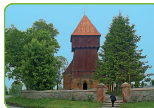
Костел в Звезно