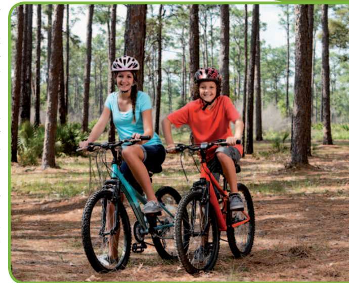
Лесные тропинки

• Мендзылесе – в восточной части деревни, возле трассы из Добре Място до Езёран, в 100 м от дороги, стоит барочный паломнический костел 88 , построенный в 1752–53 гг. Сюда направлялись многочисленные группы прихожан из Вармии, однако в начале XVIII в. тут произошло осквернение распятия.