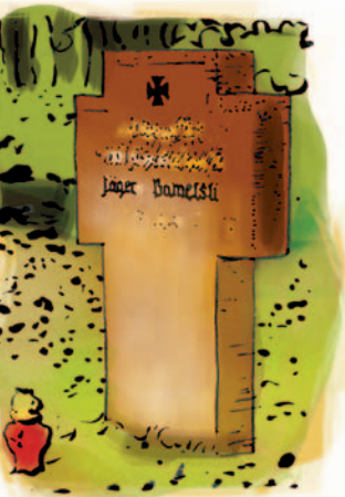
Военное кладбище в Макосее, рис. RS

ектов. Это объекты как милитаристской архитектуры – фортификации гжицкой цитадели Бойен, окопы и бункеры времен I и II мировой войны – так и замки крестоносцев и сакральные памятники во главе с паломническим костелом в Святой Липке. На маршруте также находятся менее известные объекты, такие как придорожные часовенки и усадьбы.