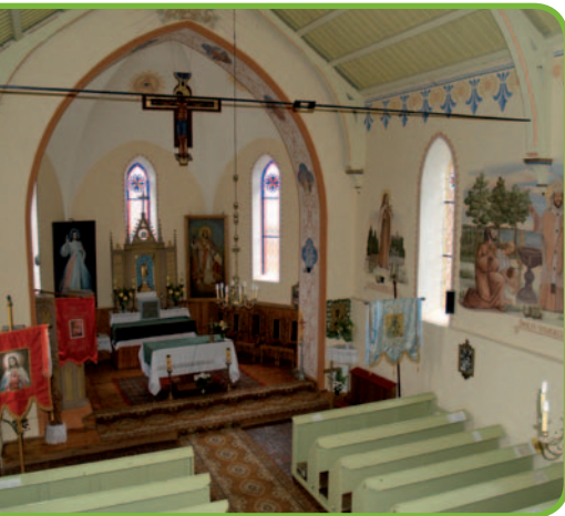
Озеро Друзно