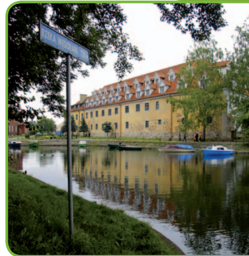
Река Венгорапа, фото GEP Chroszcz

• Брожайский канал – судоходный путь, пересекающий Скалиские леса и соединяющий Венгорапу с Голдапой. Канал построили по проекту Яна Суходольца в 1733 г. и восстановили спустя сто лет. Этот живописный канал, заиленный и заселенный бобрами, подходит только для байдарок. В некоторых местах он пересекает небольшие мореновые холмы. Маршрут проходит по лесной дороге вдоль южной части канала, в т.ч. возле разрушенного шлюза.