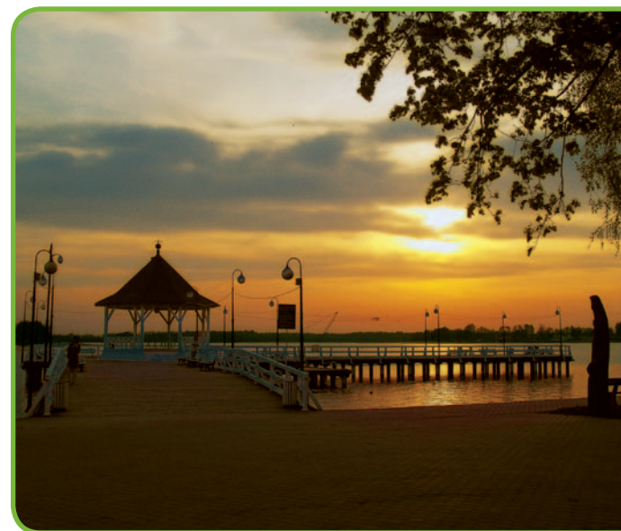
Пристань в Оструде

Прогуливаясь по набережной у озера Дрвенцкое, мы попадем в окруженный зеленью замок крестоносцев 61 , стоящий в северо-западной части старого города. От оборонительного сооружения, построенного для острудских командиров крестоносцев в 1349–70 гг., уцелели три из четырех крыльев главного здания. Одно из них сгорело вместе с башней в 1788 г. На детинце, восстановленного после 1945 г. сооружения с живописными деревянными клуатрами, сегодня расположился Центр культуры и региональный музей (ул. Мицкевича, 22, тел.: +48 89 64626602, muzeum@interia.pl). Кроме замка рекомендуется осмотреть готический костел св. Доминика 62 нач. XV в., в котором в XIX в. проповедовал пастор Гизевиус. К костелу прилежит сохранившийся фрагмент средневековой городской стены. На площади Тысячелетия польского государства есть фонтан, открытый в 2004 г. под названием Памятник европейскому единству 63 – известный с 1907 г. как Фонтан трех императоров, владевших немецкой империей с 1871 г. Другим памятником начала XX в. является Бисмаркская башня 64 .