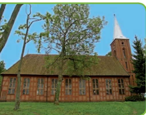
Костел в Егловнике

• Егловник – большая деревня на Жулавах может похвалиться несколькими памятниками. Стоит задержаться у костела 1804 г. (42), построенного на