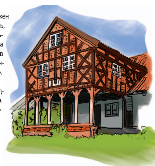
Велосипедист на маршруте