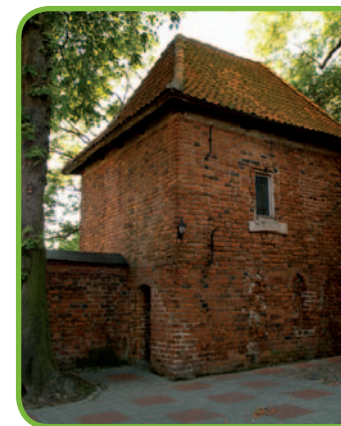
Готический костел в Ярнолтово