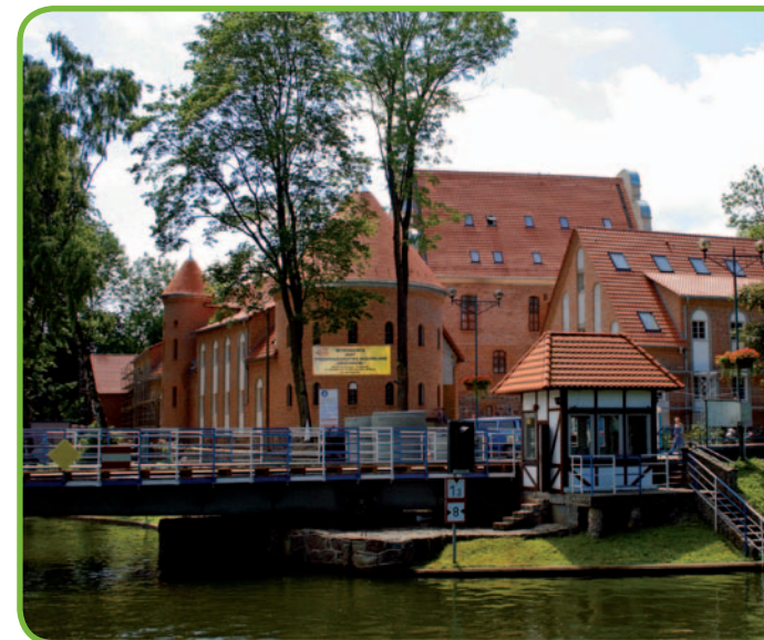
Вращающийся мост на фоне гжицкого замка

• Накомады – небольшая деревня, основанная, вероятно, под конец XIV в. крестоносцами, лежит вдали от туристических маршрутов. Не смотря на то,