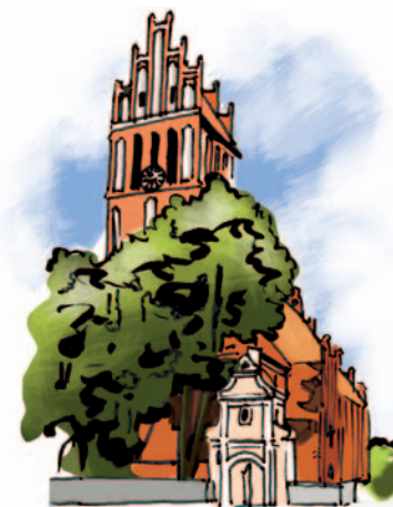
Костел св. Варфоломея в Езёранах, рис. RS