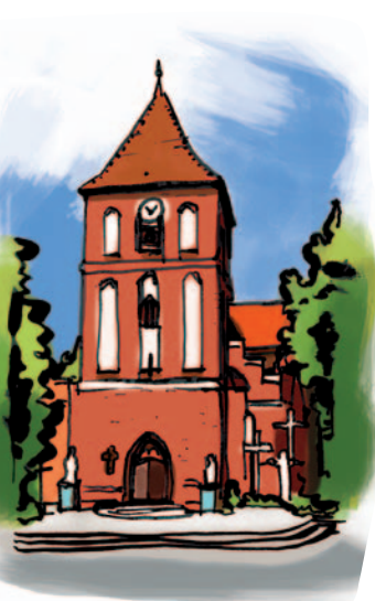
Костел св. Якова в Тольмицко, рис. RS