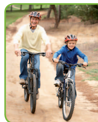
По полевым просекам

В центре Мронгово много примечательных зданий 111 , в основном XIX в. Посреди рыночной площади возвышается ратуша в стиле классицизма 112 ,