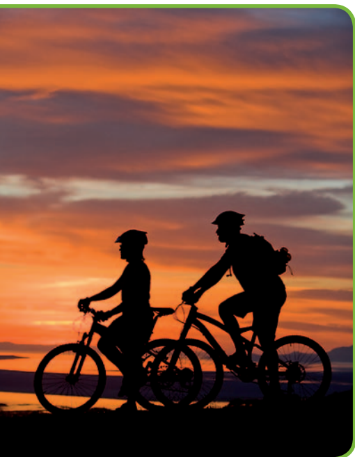
Закат солнца в пути

• Щурково – деревня существует с XIV в., в 1945 г. ее разделила граница между Польшей и Калининградской областью СССР (теперь России). В польской части деревни осталась перестроенная усадьба XIX в. 78 . Щурково известно прежде всего как крупнейшее место гнездования белого аиста в Варминско-Мазурском воеводстве.