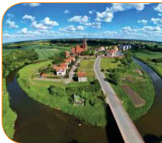
Семпополь в излучине Лыны

Главная река региона - это привлекательный байдарочный маршрут (196 км). От города Добрэ-Място он проходит, в частности, через Смолайны и Ланево до Лидзбарка-Варминского. Здесь в Лыну втекает Сымсарна, которую также стоит пройти на байдарке. Далее Лына течет через Рогуж и Перкуйки до Бартошице, а потом через Шилина-Велька до Семполя, где в нее впадает Губер. В каждой из перечисленных местностей есть водная туристическая база (в Лидзбарке-Варминском даже две), которая позволяет удобно начать или окончить поход. Последняя из водных турбаз расположена в Стопках, из которых до места пересечения рекой границы с Россией остается ок. 5 км. В нижнем течении Лыны делающий меандры поток широкий и спокойный. Основной проблемой для байдарочников является несколько гидроэлектростанций, которые вынуждают переносы.