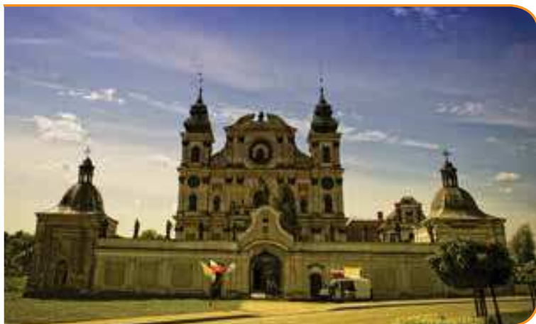
Санктuariй Посещения Пресвятой Девы Марии и св. Иосифа в Кросно, расположенный вблизи трассы

Насчитывающий 28 км маршрут намечен на насыпи бывшей железнодорожной линии, действующей в период 1905-1945. Он проходит среди полей и лесов, а характеризуется минимальными различиями высот. По пути велосипедисты проезжают старые виадуки, придорожные часовенки и стоящие посещения достопримечательности: готический костел Св. св. Креста в Опине и санктuariй Девы Марии в Кросно в стиле барокко. Велосипедисты могут воспользоваться двумя зонами отдыха с местами для барбекю, столами и скамейками (Ланево, Опин).