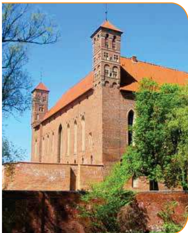
фот. Паулина Зданович