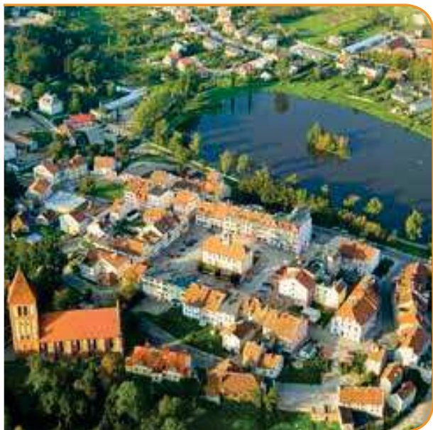
Гурово-Илавецке - город на маршруте Green Velo

Часть этого самого длинного велосипедного маршрута в Польше проходит через варминско-мазурское воеводство (ок. 395 км) и позволяет посетить его северные территории, очень живописные и чрезвычайно богаты природными и культурными достопримечательностями. В регионе выделены три отрезка пути, называемые велосипедными царствами: «Побережье Вислинского залива» (93 км), «Вармия и окрестности» (147 км) и «Северная Мазурия» (153 км). Маршрут проходит, в частности, через города, принадлежащие к Cittaslow: Гурово-Илавецке, Лидзбарк-Варминьски, Бартошице, Семпопол («Вармия и окрестности»), Голдап («Северная Мазурия»). Очередные этапы преодоления Green Velo можно разнообразить экскурсиями по многочисленным локальным маршрутам. Едущие по маршруту могут воспользоваться Пунктами обслуживания велотуристов, оборудованными стойками, скамейками, столами, навесами, урнами для мусора и информационными стендами. Туристов также ждут Места, благоприятные для велосипедистов, то есть рекомендуемые объекты (ночлеги, общественное питание, бытовое обслуживание), которые могут адаптировать свое предложение к потребностям любителей двух колес.