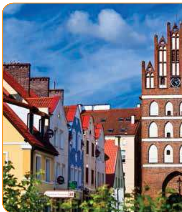
Старые дома и Лидзбарские ворота в Бартошице