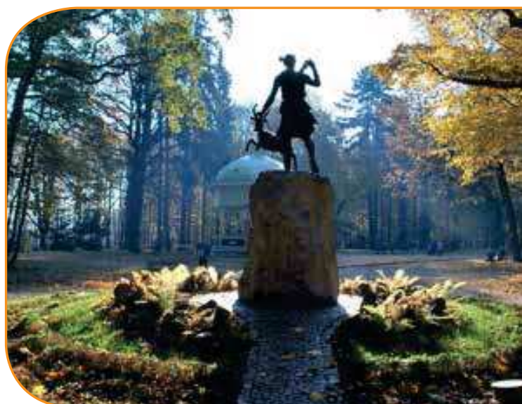
Городской парк в городе Прудник

Город и его окрестности - это идеальное место для велотуризма. Здесь есть трассы как для семей, так и предназначенные для опытных велосипедистов. Помимо достоинств природы, более привлекательными их делают обзорные башни и бивачные места. Благодаря сотрудничеству с чешскими партнерами, велосипедные маршруты соединяют города по обе стороны границы. Маршрут «По следам Франчишка Сурминьского и Станислава Шозды – легенд польского велоспорта» ведет возле таких интересных мест, как Санктуарий святого Иосифа в городе Прудник-Ляс, где был заключен в тюрьму примас Стефан Вышински. Велосипедная инфраструктура Опавских Гор позволяет организовать мероприятия для любителей и профессионалов. Самый известный это Мемориал им. Станислава Шозды, который каждые два года имеет ранг отборочного турнира Чемпионата Польши в Дорожной категории.