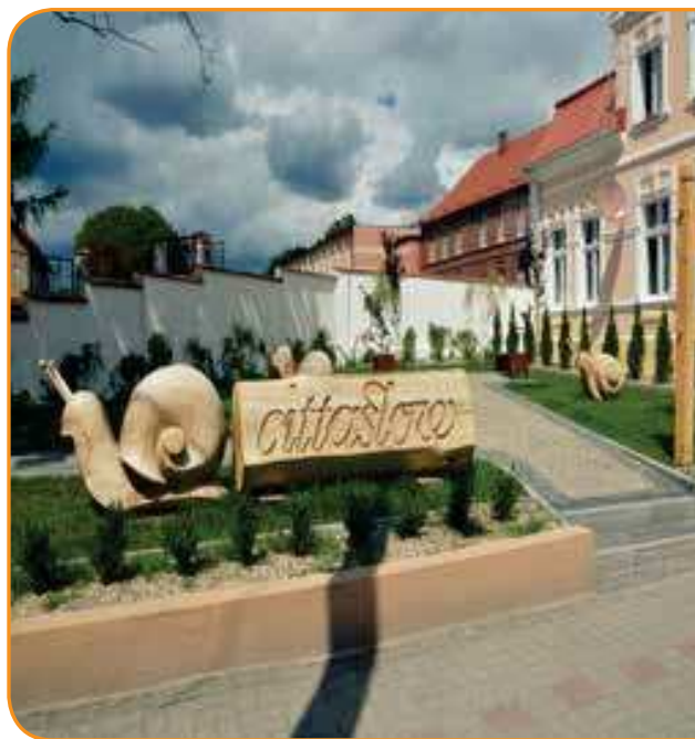
Сквер Cittaslow в Лидзбарке, фот. Наталья Сер

На последующих страницах данной публикации мы приближаем выбранные достопримечательности каждого из городов, предлагая несколько экскурсий, которые позволят почувствовать их характерный климат. Текущую информацию о том, что происходит в каждом из городов, можно найти на www.cittaslowpolska.pl .